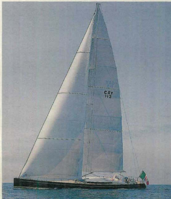
S/Y P2 Cantiere Perini Navi Lunghezza fuori tutto 38 m Larghezza 8,36 m Immersione 3,5/5,5 m Superficie velica: 734 mq Albero 50 m Cabine 3 Posti letto 6/8

PERINI Navi espone in anteprima mondiale il suo nuovo scafo S/Y P2: in seallium, una speciale lega di alluminio, e con interni raffinatamente disegnati con salone e pozzetto protetto da un tendalino avvolgente. Bagni privati nelle cabine, due tender e un pescaggio che scende da 5,5 a 3,5 metri per facilitare gli approdi.