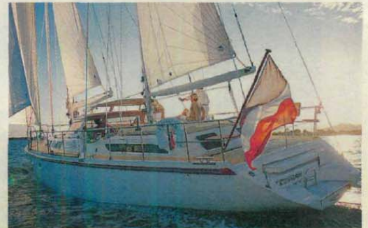
AMEL 54 Cantiere Amel Méditerranée Lunghezza fuori tutto 17,20 m Baglio 4,80 m Pescaggio 2,10 m Dislocamento 17,50 t Superficie velica 140 mq Motore 110 hp Serbatoio d'acqua dolce 900 l